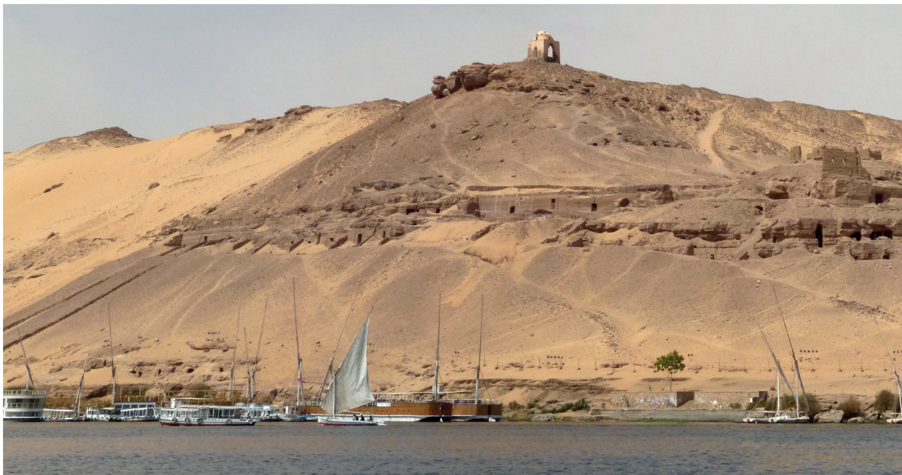
VISTA GENERAL DE LA NECRÓPOLIS DE QUBBET EL-HAWA.

La egiptología española es, si cabe, más reciente. Algunos arqueólogos españoles han trabajado en Egipto durante el pasado siglo, sin embargo, no ha existido un marco institucional que ayude a la creación de una egiptología española, que conlleve la producción científica y la formación de especialistas en la materia. En las últimas décadas, nuestras universidades están lanzando proyectos que se incorporan a esta ciencia de la antigüedad, que tradicionalmente ha estado dirigida desde el ámbito científico anglosajón, alemán y francés.